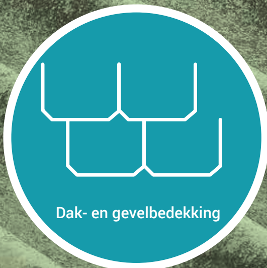
Dak- en gevelbedekking

Uit beschadigde asbesthoudende materialen kunnen asbestvezels vrijkomen. Beschadiging ontstaat door wrijving (schuren, boren ...) en breken. Door ouderdom en verwerking van asbesttoepassingen kunnen echter ook asbestvezels vrijkomen zonder dat het materiaal beschadigd is. Wanneer asbestvezels loskomen, zijn ze zo fijn en volatiel dat ze blijven zweven en zich zeer gemakkelijk in de lucht verspreiden. Ze kunnen ingeademd worden en de longblaasjes diep in de longen bereiken.